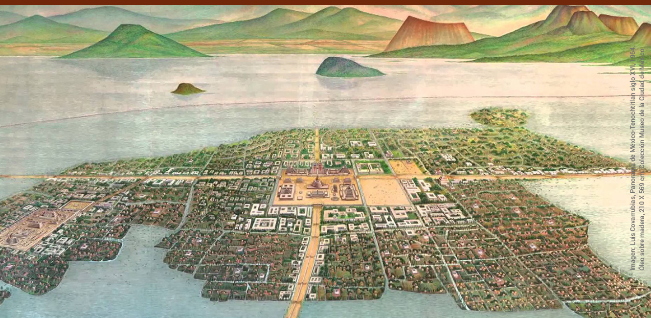
Imagen: Luis Covarrubias; Pano de la Ciudad de México-Tenochtitlan siglo XVI, 1964. Óleo sobre madera, 210 X 569 cm. Colección Museo de la Ciudad de México.